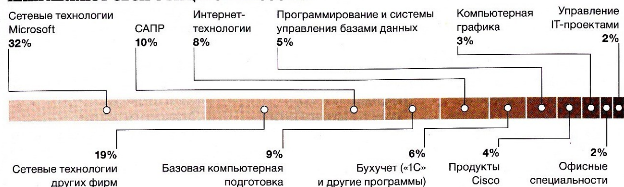
РИСУНОК 2 НА КАКИЕ КУРСЫ ВОЙСКОВЫЕ ЧАСТИ НАПРАВЛЯЮТ СВОЙ ОФИЦЕРСКИЙ СОСТАВ